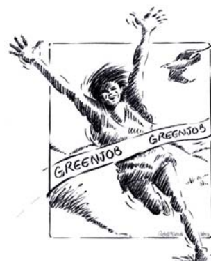
Omloop Ter Heijde

email adres: astrid.zoutman@kabelfoon.nl